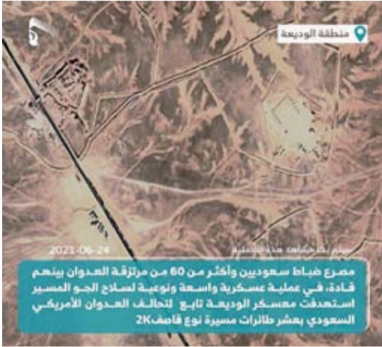
مصرع ضباط سعوديين وأكثر من 60 من المرتزقة العدوانيين ينجم عن عملية عسكرية واسعة ونوعية لسلاح الجو المسيّر استهدفت معسكر الوديعية تابع تحالف العدوان الأمريكي السعودي بعشر طائرات مسيرة نوع قاصف 2K السعودي