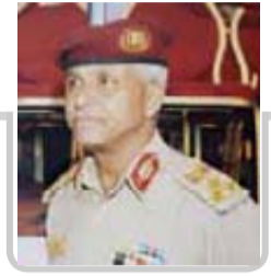
قراءة وتحليل: العميد أنور الماوري

يواصل مجلس النواب عقد جلسات أعمال فترته الحالية ابتداءً من اليوم الاثنين. ويقف نواب الشعب أمام القضايا المدرجة في جدول أعمال المجلس في إطار مهامه الدستورية في الجانبين التشريعي والرقابي.