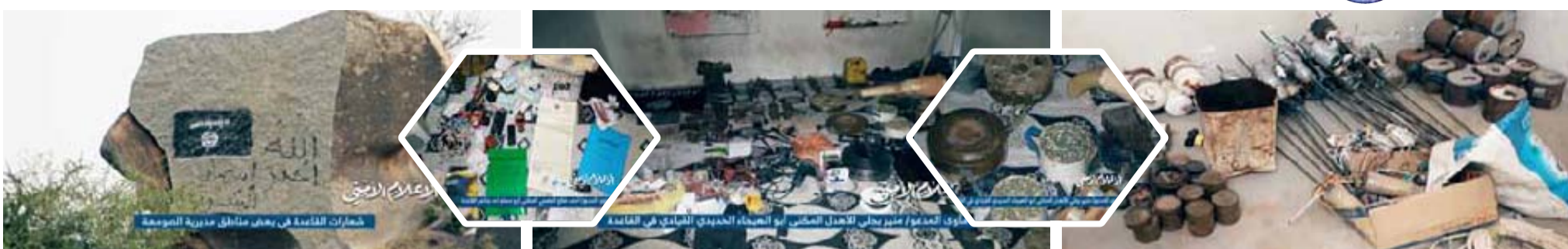
مصدر أمني يكشف تفاصيل الدور الأمني في عملية «فجر الحرية»