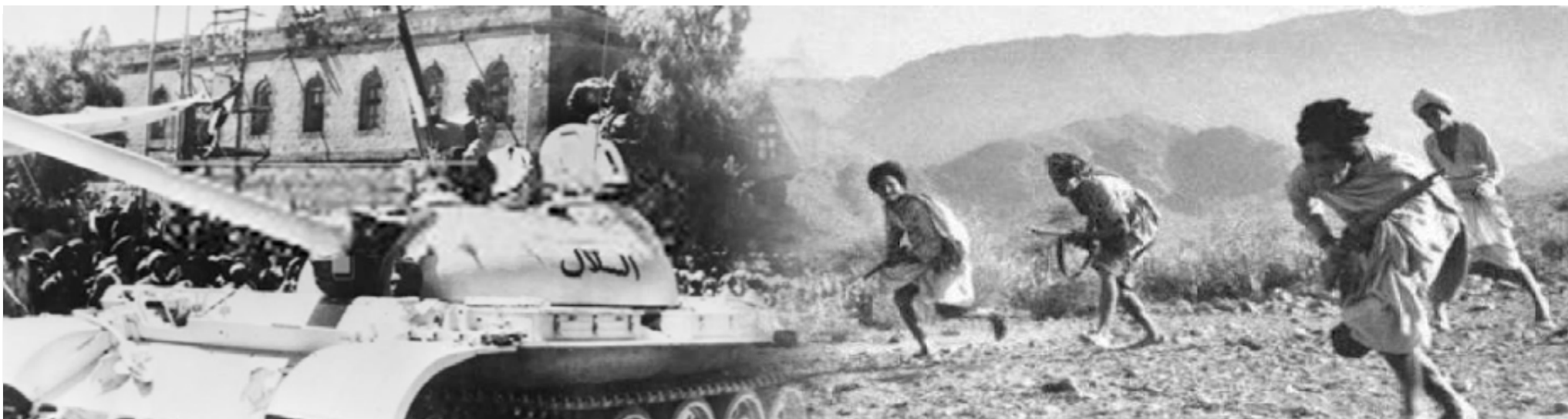
ترانم مع احتفالات شعبنا اليمني بثورة ٢١ وال٢٦ من سبتمبر

قادة عسكريون وميدانيون يتحدثون لـ "الشمس"