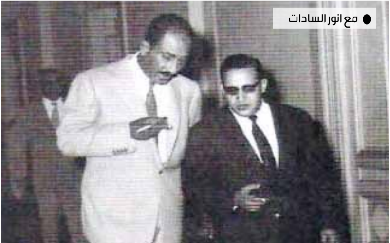
● مع انور السادات

>> كنا في ركبتين متباعدين في المطار.. وقد ذكر للصحافيين أنه سيقضي على الثوار بمجرد وصوله الى الحدود اليمنية.. وقد رددت على هذا القول بأن يحاول ان يعيد عقارب الساعة الى الوراء هو كمن يحاول ان يشد الشمس من كبد السماء.. وقد رددت هذا التصريح اذاعة لندن بعد ذلك.. وفي القاهرة نظم الطلاب اليمنيون حفلا كبيرا في نقابة الصحافيين وكانوا يفيضون بهجة وحماسة وتفاؤلا.. وقد تحدثت اليهم واقترحت ان يعود كبارهم والمتقدمين في دراستهم الى اليمن.. وقلت لهم ان ظروف اليمن تستدعي بذل كل الجهود