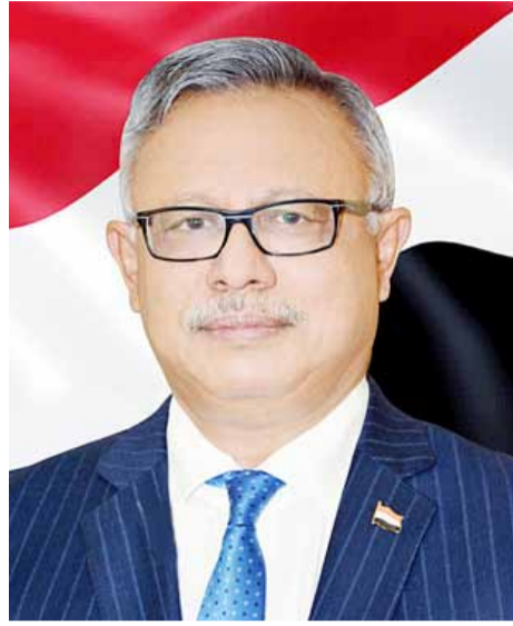
أ.د. عبدالعزيز صالح بن حنبور #

في صباحة اليوم التالي للمعركة الفاصلة في دار الرئاسة (قصر الدور) وفي تمام الساعة الحادية عشرة قبيل الظهر تم طلب أعضاء المكتب السياسي لإجماع عاجل في قصر العاشيق بضاحية كريت، وذهب الجميع فرادى وجماعات من أعضاء القيادة وقبل اكتمال النصاب الحزبي القانوني من جميع أعضاء المكتب السياسي، تم جلب الرئيس / سالمين عنوة مكبل اليدين من الخلف بالأصقاف الحديدية وبجانبه كل من الرفيق / جاعم صالح اليافعي والرفيق / علي سالم لعود