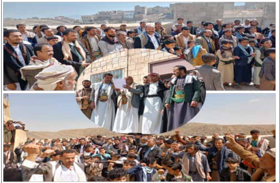
اليمني والأمة الإسلامية في ذكرى استشهاد السيد حسين بدر الدين الحوثي، وكذلك بمناسبة الذكرى السنوية للشهيد الرئيس صالح الصماد. هذا وكانت قد أقيمت بالعاصمة صنعاء والمحافظات صلاة الغائب على

أرواح الشهداء محمد الضيف ورفاقه الذين ارتقوا في معركة "طوفان الأقصى". يذكر أن لجنة نصره الأقصى دعت جماهير الشعب اليمني، إلى أداء صلاة الغائب على أرواح الشهيد محمد الضيف ورفاقه عقب صلاة الجمعة، استجابة لدعوة حركة حماس.