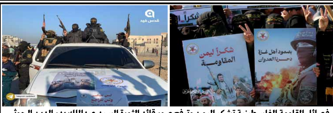
فصائل المقاومة الفلسطينية تشكر اليمن وترفع صور قائد الثورة السيد عبدالملك بدر الدين الحوثي

تعرض قناة "المسيرة الفضائية" بعدما من مساء اليوم الاثنين الفيلم الوثائقي "البصمة الأمريكية" والذي يتضمن مسرح الجريمة ويتتبع نوع السلاح المستخدم والطائرات التي شاركت في اغتيال الرئيس الشهيد الصمد.